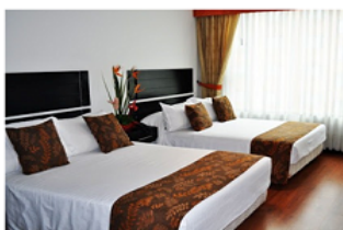
TWIN BED - DOBLE